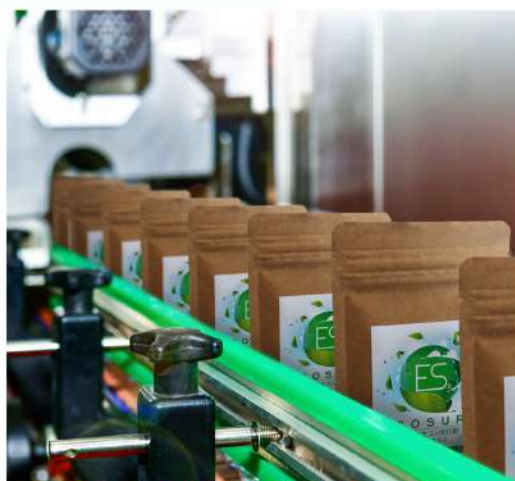
エコスル2 生産ライン